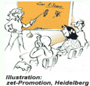
Illustration: zet-Promotion, Heidelberg